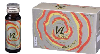
『エクスワン VL(ヴィエル)ゴールド』