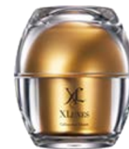
『エクスリ्यूクス セルリカバークリーム』