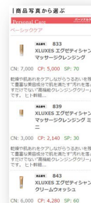
エクスワン スマホ対応サイト イメージ