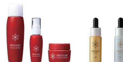
新スキンケアシリーズ『ORIGAMI(オリガミ)』