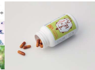
『エックスワン VS(ヴィエス)』