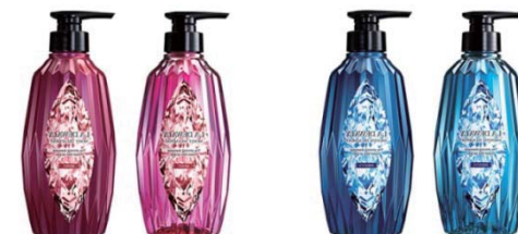
『ラ デュワリー シャンプー & トリートメント』