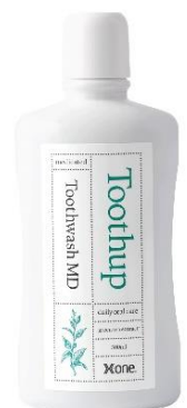
「トゥーサップ 薬用液体歯ミガキ MD」