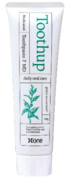
「トゥーサップ 薬用歯みがき F MD」