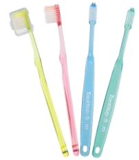
「トゥーサップ S 歯ブラシ」