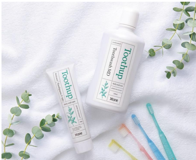
「トゥーサップ 薬用液体歯ミガキ MD」（中央）