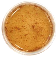
使用後に出るカスのイメージ (但し、カスの出方には個人差があります)

ニオイは口内の細菌がたんぱく質を分解する時に発生します。 茶葉エキス※ 1 に含まれるカテキンが、たんぱく質の汚れと結合し、 汚れとニオイ菌を吸着して除去します。